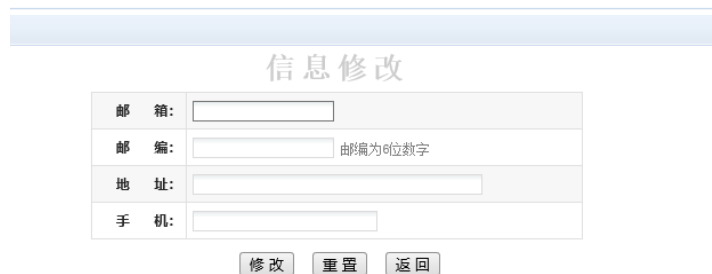
图 3.2.1-1 个人信息修改