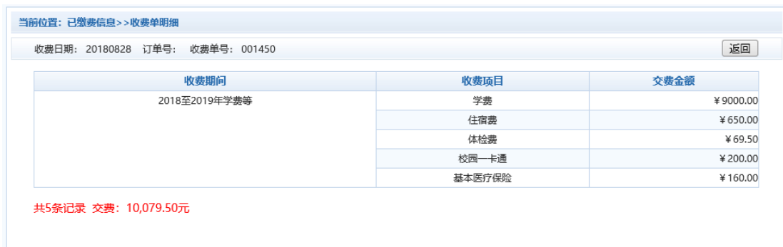
图 3.7.2 已缴费明细