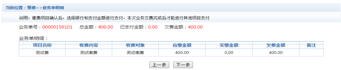
图 3.5-2 业务单费用确认