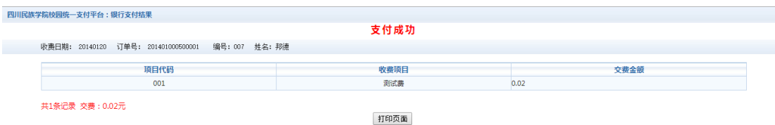
图 3.6-3 缴费凭证

若是其他缴费的订单，可以点击缴费凭证，查看和打印缴费凭证。如图 3.6-3 所示