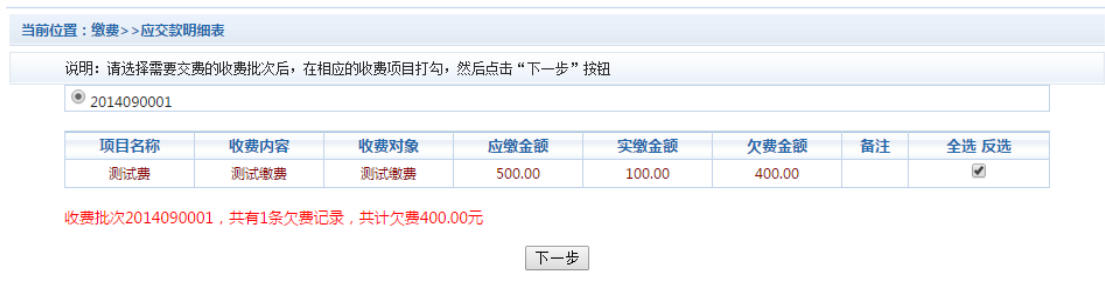
图 3.5-1 其他零星欠费

点击导航栏的“其他缴费”按钮，进入其他零星缴费显示和选择页面，如图 3.5-1 所示。