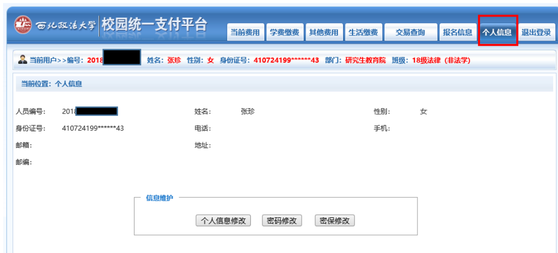
图 3.2-1 个人信息维护界面

登陆支付平台后，点击导航栏的个人信息按钮，显示个人信息确认及维护界面。如图 3.2-1 所示。 请确认个人信息无误后再进行缴费，避免误交费。