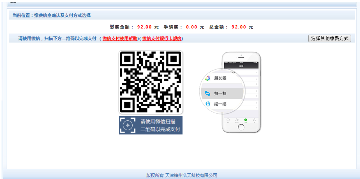
图 3.4-5 微信网上支付