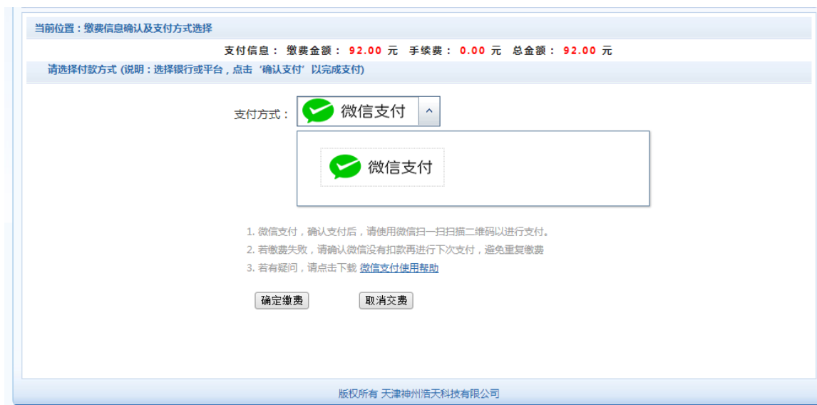
图 3.4-4 缴费方式选择