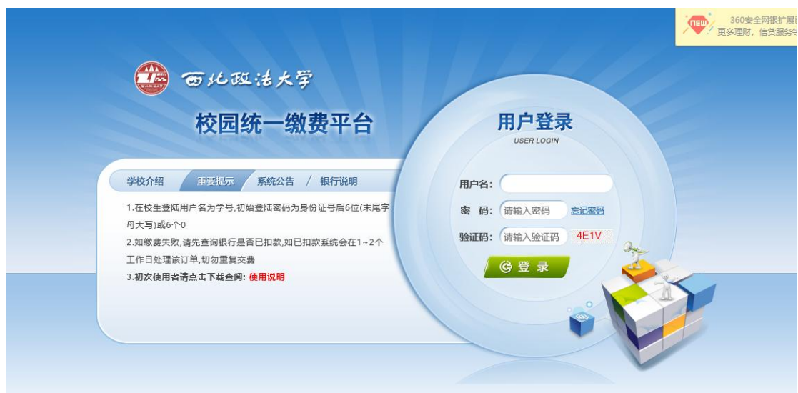
图 3.1-1 统一支付平台登陆界面

登录中国政法大学财务处网站，点击“网络缴费”，如图 3.1-1 所示。登陆之后显示个人欠费信息，如图 3.1-2 所示。