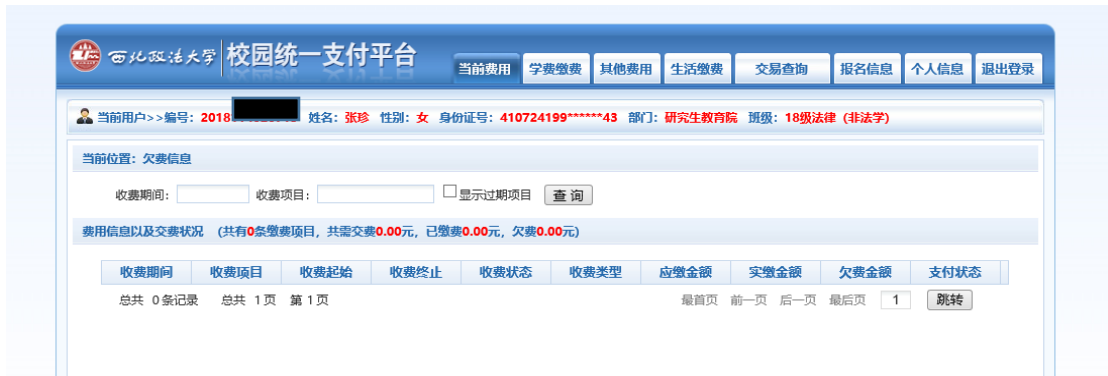
图 3.1-2 统一支付平台登陆后页面