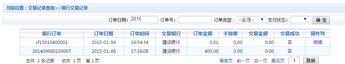
图 3.6-1 交易记录查询

点击导航栏的“交易记录查询”按钮，可以查询具体的交易记录。如图 3.6-1 所示。