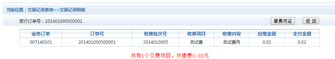
图 3.6-2 交易记录明细

若是其他缴费的订单，可以点击缴费凭证，查看和打印缴费凭证。如图 3.6-3 所示