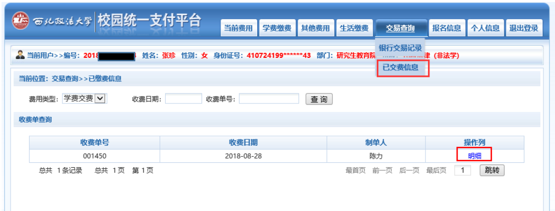
图 3.7-1 已缴费信息显示