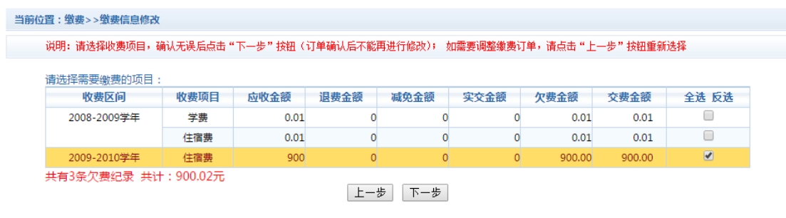
图 3.4-2 缴费项目选择